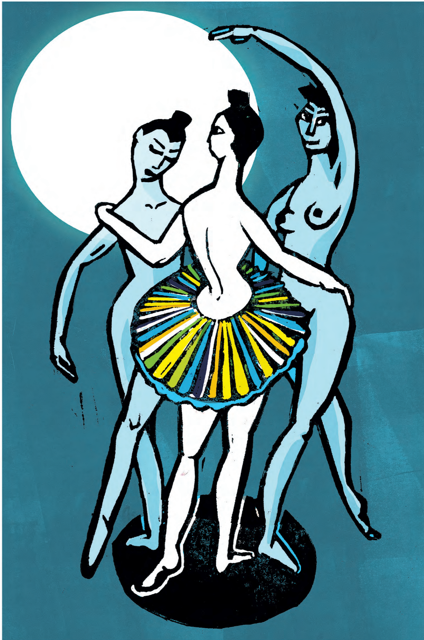
ILLUSTRATIE OLIVIA ETEMA

De organisatie van het cultuurbeleid is doorgeslagen in regelgeving , terwijl flexibiliteit nodig is.